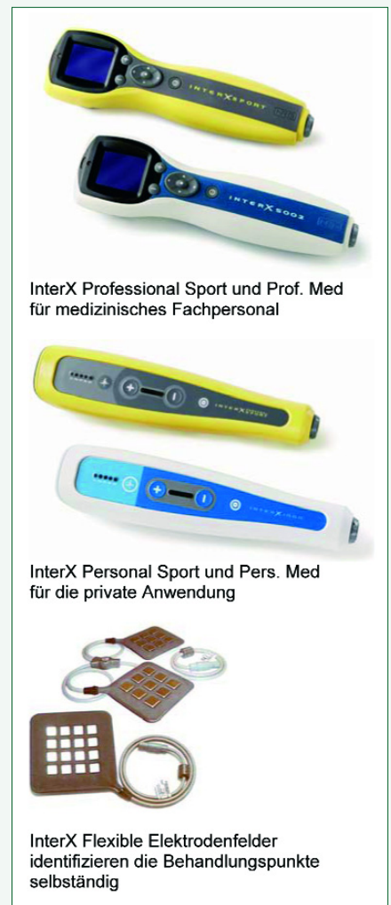
Abb. 3: Die neue InterX-Serie mit „intelligenten“ Elektrodenfeldern erleichtert die Anwendung

Ziel der amerikanischen Neuro Resource Group in Texas war es, eine seit vielen Jahren bewährte Technik in ein hochwertiges, effizient einsetzbares Handgerät zu integrieren,